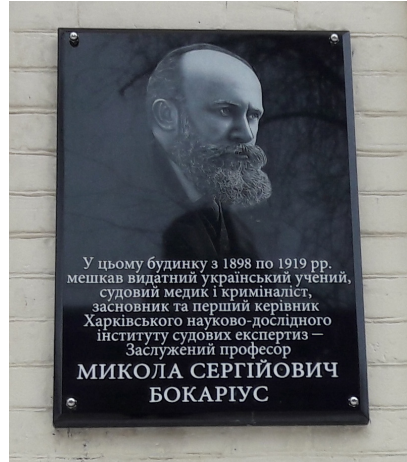
Рис. 2. Пам'ятна дошка на честь Засл. проф. М. С. Бокаріуса (вул. Чернишевська, 46, м. Харків)

площі ім. Держинського (нині — пл. Свободи)» 26 .