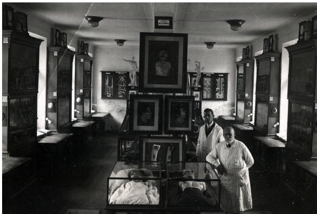
Рис. 3. У музеї Інституту судової медицини (1930)

М. С. Бокаріус зробив значний внесок у становлення та розвиток української судової медицини. Ще на початку своєї праці на кафедрі судової медицини (1897) він не тільки висунув ідею про необхідність спеціальної підготовки судових експертів-медиків і їхньої взаємодії зі спеціалістами з криміналістики (як під час навчання, так і в подальшій роботі), а й активно реалізовував таку взаємодію у власній науковій діяльності.