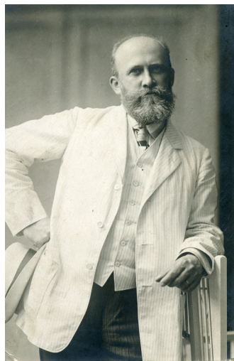
Рис. 1. Професор М. С. Бокаріус

У 1907 р. М. С. Бокаріус запропонував новий реактив для отримання кристалів під час дослідження сім'яної рідини. Ці кристали увійшли в літературу як кристали Бокаріуса . У 1910 р. Миколу Сергійовича затвердили завідувачем кафедри судової медицини, того самого року він здобув науковий ступінь доктора медицини та звання професора 20 , а також першим у Російській імперії провів дактилоскопічну експертизу. Він також винайшов оригінальну конструкцію дактилоскопічної лупи, що давала