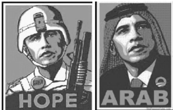
Рис. 5. Сучасні сатиричні варіації на тему «Плакату Надія»

Значно оригінальнішим (завдяки нетиповому поєднанню гетерогенних візуальних складових, які не продукують узвичаєні асоціації за схемою «відома людина та її професія») у цьому сенсі здаються сучасні сатиричні варіації на тему «Плакату Надія», створені американським художником-гумористами (рис. 5.) на основі твору Ш. Фейрі. Разом із тим, дослідивши інформацію на жорстких дисках комп'ютерів у студії Ш. Фейрі, експерти встановили, що фотограф дійсно використав шляхом перероблення фотографічний твір, що належав «Ассошейтид Прес».