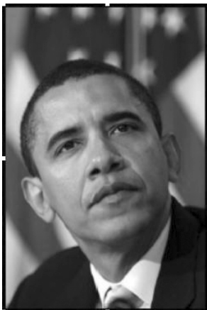
Рис. 1. Знімок президента Б. Обами

Отже, у січні 2008 р. професійний американський фотограф Ш. Фейрі використав знімок президента Б. Обами (рис. 1) як основу для власного твору – агітаційного поліграфічного виробу із назвою «Плакат Надія» (рис. 2). Цей плакат, а точніше стилізований портрет на ньому, згодом був поширений у різноманітних форматах (на одязі, посуді, сувенірній продукції) та здобув чималу популярність серед американських споживачів. Як наслідок, Ш. Фейрі отримав значні прибутки – понад три мільйони доларів від продажу ліценцій на використання зображення майбутнього президента, а відтворення фотографії Б. Обами у творі «Плакат Надія» мало чіткі ознаки його використання із комерційною метою.