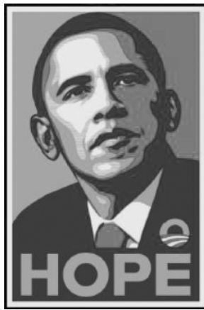
Рис. 1. Ш. Фейрі. «Плакат Надія»

Власники авторських прав на фотографію – відоме агентство новин «Асошіейтід Прес» (яке заявило про себе як про власника прав на твір), звернулося до Ш. Фейрі з вимогою компенсувати збитки, адже фотограф використав їх фотографічний твір без належного дозволу. Коли перемови щодо можливої мирової зайшли в глухий кут, фотограф апелював до суду із проханням створити комісію експертів і мистецтвознавців, які мали дослідити всі факти та допомогти суду вирішити спір. Справа розглядалася впродовж двох років і зрештою завершилася підписанням мирової угоди, умови якої є конфіденційними. Утім обставини розгляду матеріалів справи «Шепард Фейрі проти Асошіейтід Прес» експертною комісією добре відомі фахівцям і вважаються своєрідним зразком для наслідування.