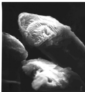
Рис. 2. Волокно, розділене ножицями, що мають затуплені лева

При розрубі гострою сокирою звертає на себе увагу наявність на кінцях волокон відносно рівної торцевої поверхні, сплюснення (здавленості) і мілкоскладчастості (рис. 3).