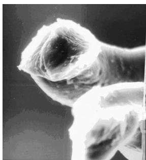
Рис. 3. Волокно, розділене при розрубванні гострою сокирою

При розрубі гострою сокирою звертає на себе увагу наявність на кінцях волокон відносно рівної торцевої поверхні, сплюснення (здавленості) і мілкоскладчастості (рис. 3).